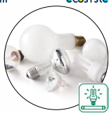
Ampoules, néons et tubes