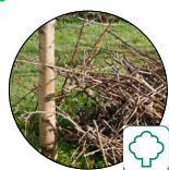
Végétaux (feuillage, branchage...)