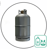
Bouteilles de gaz