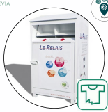
Textiles, linges de maisons et chaussures