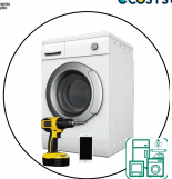
Appareils électriques et électroniques