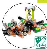
Piles et accumulateurs