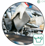
Huiles de vidange