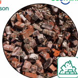
Déchets inertes (Gravats..)