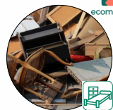
Mobilier intérieur, extérieur, couettes et oreillers. Jouets, articles de bricolages et de jardin